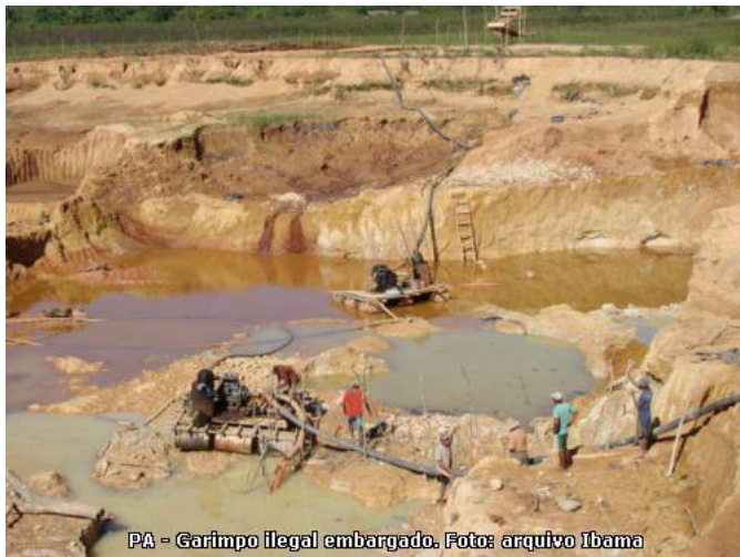
PA - Garimpo ilegal embargado.